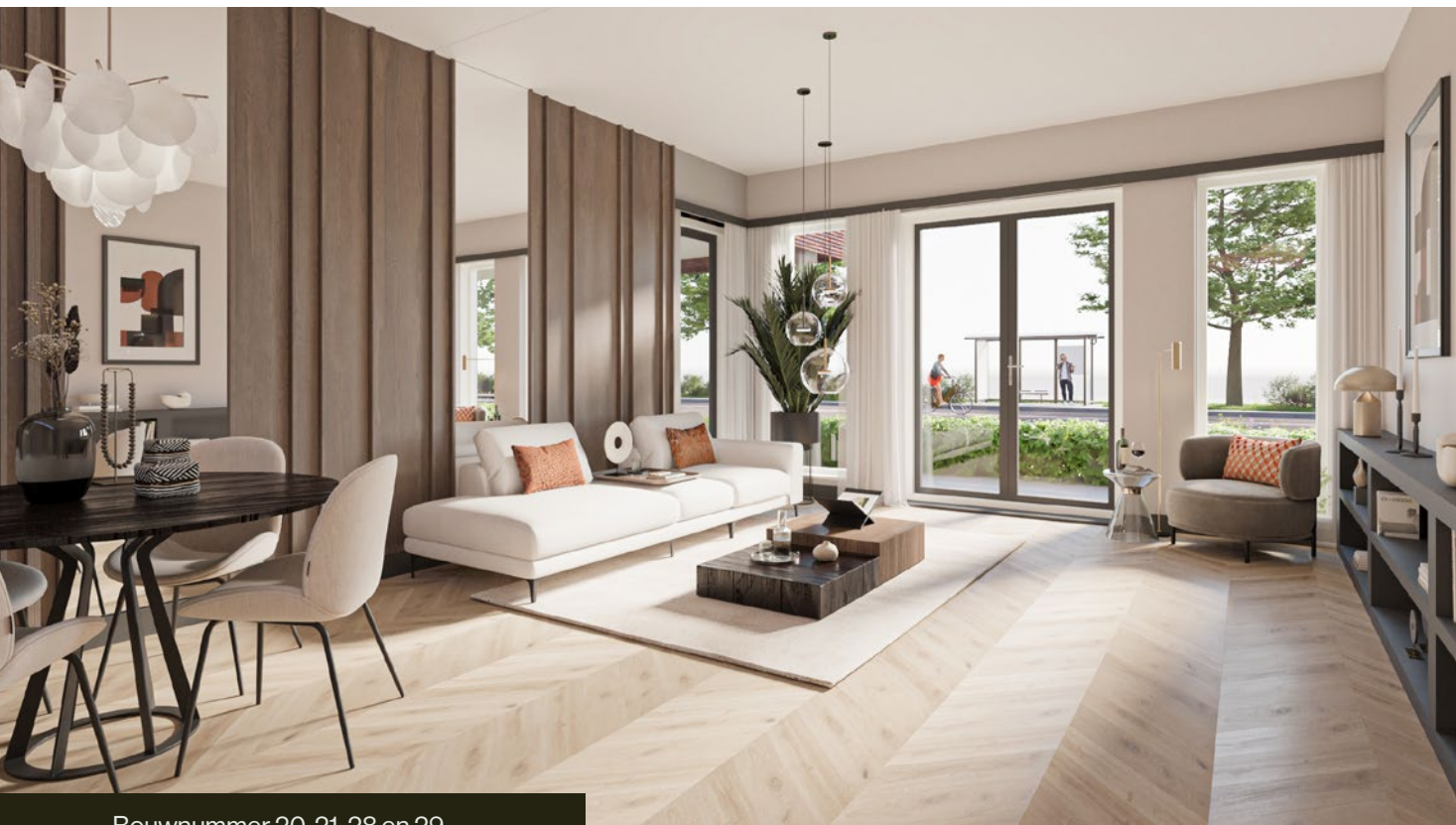
Bouwnummer 20, 21, 28 en 29